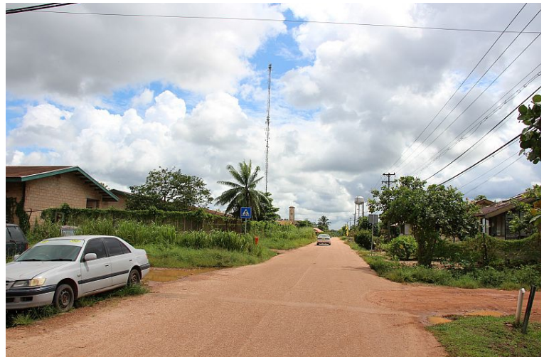
Buitenwijk van Moengo

De afgelopen weken heb ik wel twee maal een dienstreis naar Moengo gemaakt. Het plaatsje Moengo ligt op 100km oostelijk van Paramaribo en de weg er heen voert grotendeels door een groen woud. Ik moest daar zijn om dat er een probleem was met de tv zender die voor dat gebied daar staat. De eerste keer ging ik er met een chauffeur heen om het probleem daar te onderzoeken en de apparatuur gedeeltelijk naar Paramaribo mee terug te nemen. Deze week ging ik er weer heen, nu met de directeur, om de zender daar opnieuw in bedrijf te stellen. Tijdens de reis